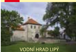
VODNÍ HRAD LIPÝ

Tanvaldská 38, Liberec – Vratislavice nad Nisou, T: +420 326 832 028, +420 326 832 038, E: vratislavice@skoda-auto.cz, rodnydumporsche.cz , muzeum.skoda-auto.cz