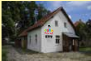
Historie kartonůvek na Českolipsku. Expozice umožňuje aktivní zapojení návštěvníků.