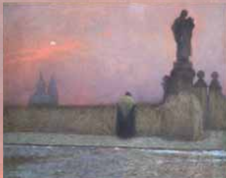
Gegen Abend auf dem Hradschin, (1910-1915)

Waldstein-Reithalle 20. 4. – 21. 10. 2012