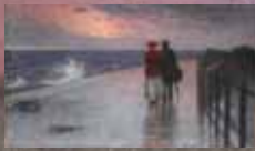
Auf Hochzeitsreise (Auf dem Kai), (1922-1924)